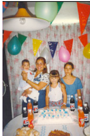
El padre, siempre ausente en los cumpleaños